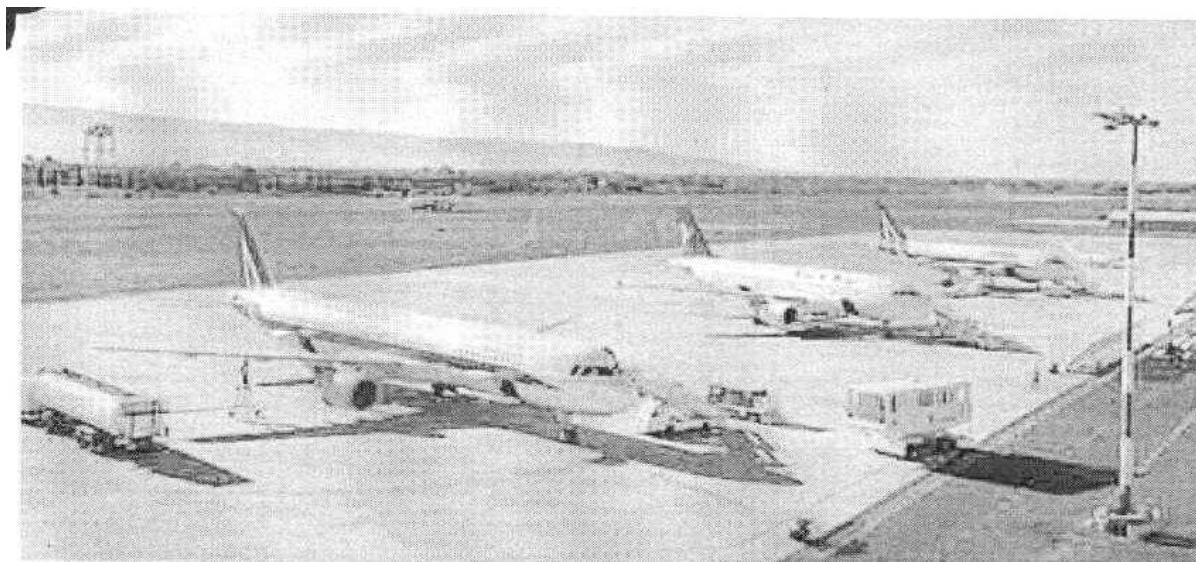
Aerei sulla pista comisana. L'aeroporto degli Iblei ha gestito con grande professionalità l'emergenza dovuta alla potente eruzione dell'Etna delle scorse settimane